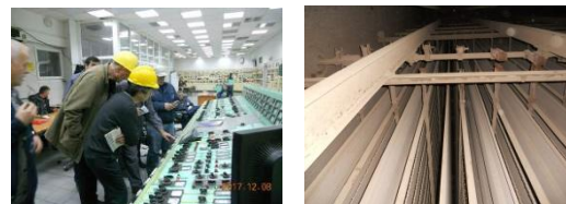
Vizitat për hulumtimin në terren të TC-ve

Aktivitetet e zhvilluara në dhjetor 2017 kanë qenë shqyrtimi i kontrollit të emisioneve në termocentrale (këtu e tutje "TC") dhe mbledhja e informacionit për Vlerësimin e Cilësisë së Ajrit përmes mbajtjes së seminarit.