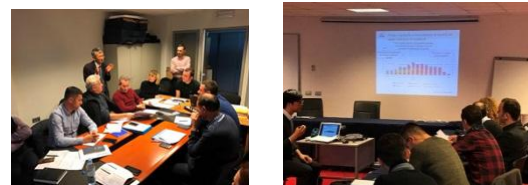
Seminari në MMPH